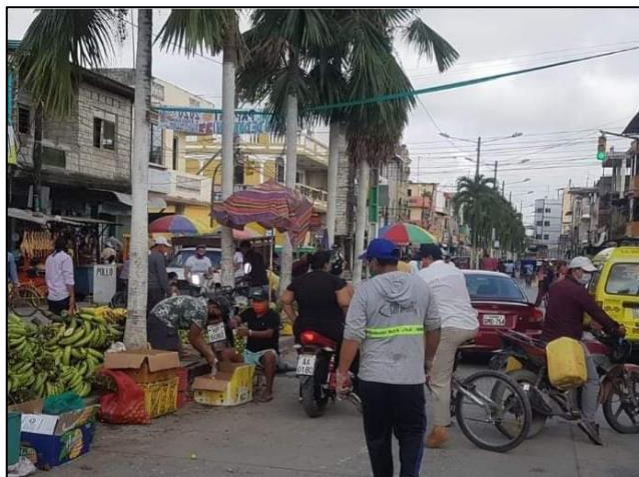
Fotografía Nº1 Aglomeración de gente en la Av. 24 de Mayo

Se denota a continuación una fotografía en la que se presencia la aglomeración de la gente en el sitio de vendedores informales.